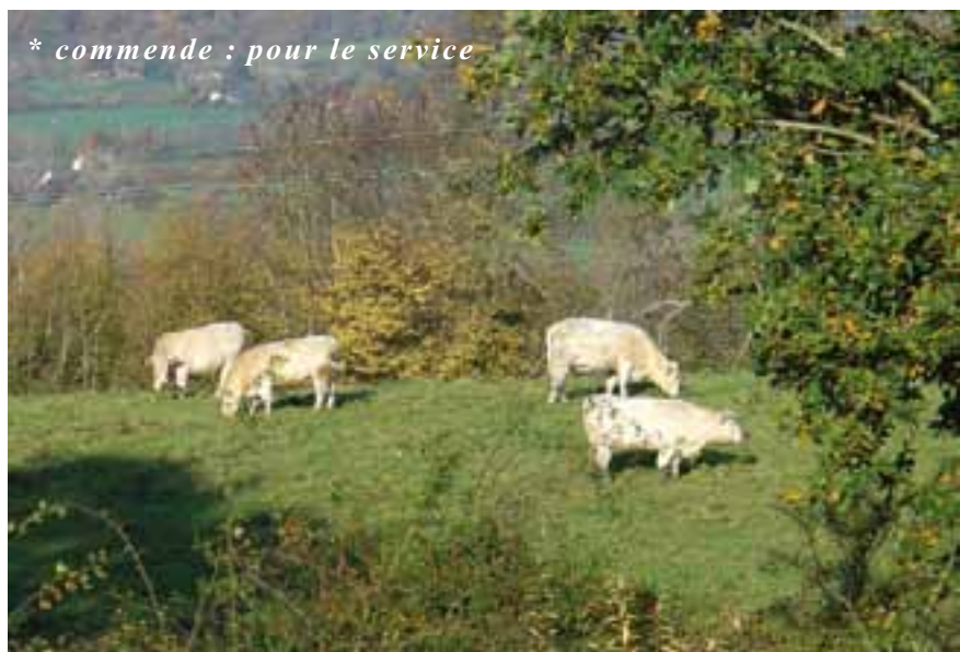
* commende : pour le service

Jean Paul II et le Cardinal Ratzinger ont fait l'unité dogmatique ou à peu près avec les orthodoxes et les disciples de Luther. Reste la discipline, l'organisation des disciples selon le sacrement