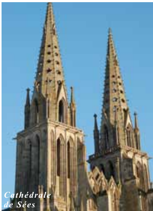
Cathédrale de Sées

Si le vert est « l'apogée de la jeunesse » c'est que le Père et l'Esprit sont plus jeunes que Jésus, tous les trois éternels avec, pour Jésus, 33 ans de plus de vie incarnée.