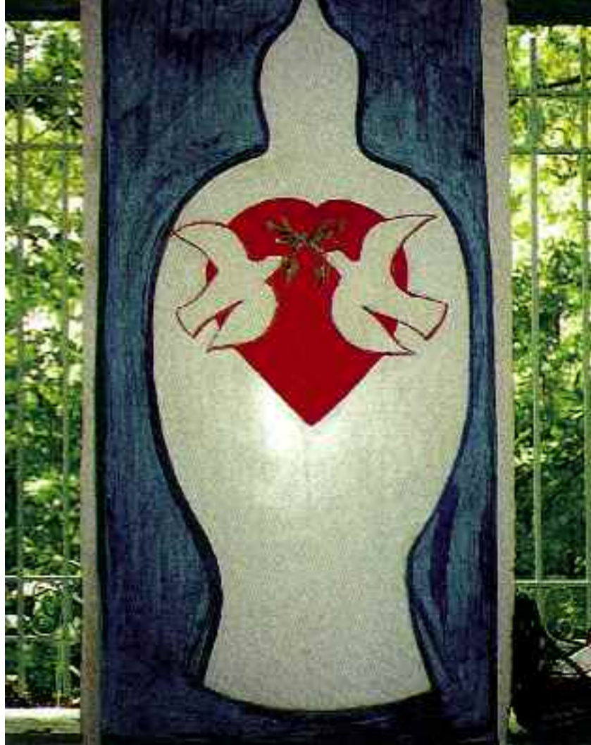
Fresque de Nausicaa Kalos

Le blason "taillé" de l'héraldique, nous dit l' automutisme des sensations taillées en pièces.