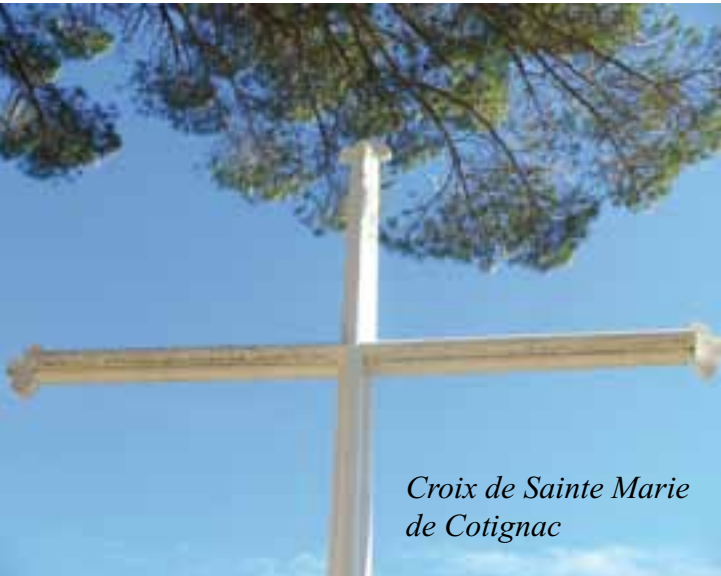
Croix de Sainte Marie de Cotignac

La rose rouge de Marie « c'est l'amour de Dieu de la justice (signe de la terre et des cieux nouveaux selon St Pierre) ... de la miséricorde (le cœur pour les miséreux et les misérables) ... de la croix de la rédemption, du sang du Christ. » C'est Marie « refuge des pécheurs, mère de miséricorde comme Mère des douleurs, comme Reine des martyrs. » C'est la chasteté de Marie dont un glaive de douleur a frappé et frappe toujours le cœur de Marie. Une bénédictine