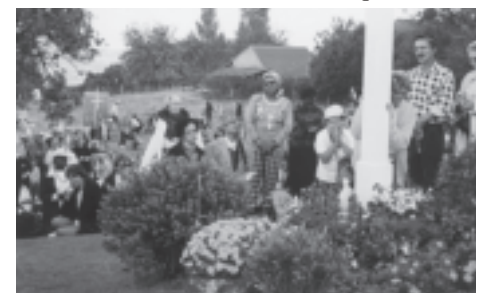
Dozulé, le 20 décembre 1998

Réf. : La Table pastorale de la Bible, Passelecq-Poswick